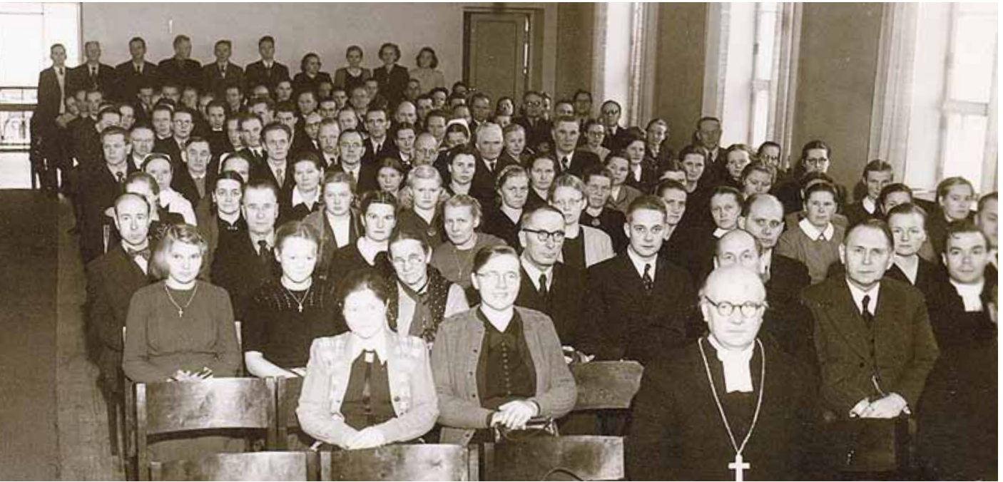
Yhteyttä on vaalittu Kuopion hiippakunnassa alusta alkaen. Kuva Seurakuntatyön neuvottelupäiviltä v. 1950.

Yhteisyyttä rakennettiin myös julkaisemalla vuodesta 1949 lähtien Herran työ -hiippakuntalehteä. Kussakin numerossa esiteltiin laajasti vuorollaan yksi seurakunta ja sen toimintaa.