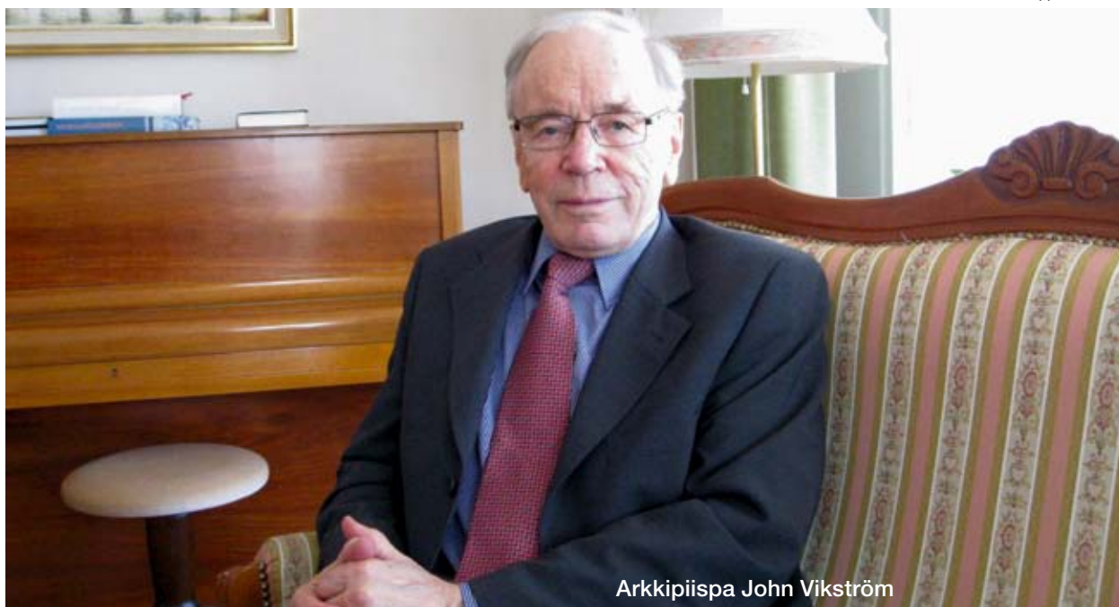
Arkkipiispa John Vikström